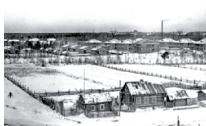
Первым строился микрорайон «Щ» — это были щитовые деревянные бараки для строителей (отсюда и название — «Щ») неподалеку от железнодорожной станции Сеятель и небольшой деревни Чербузы. На снимке: дома старой деревни и строящегося поселка строителей. 1959 г.