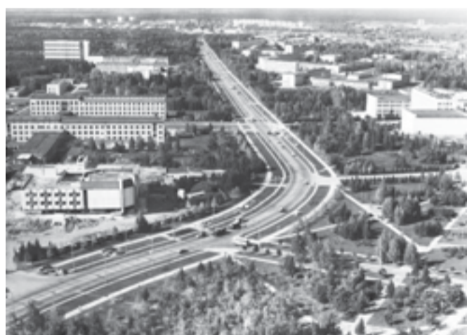
Проспект Академика Лаврентьева. Вид сверху. 1980 г.

Очевидно, что он был одним из «локомотивов» создаваемого района. Тот самый научный центр в Сибири, о котором так много говорили, и проект которого так усиленно продвигали три академика: Михаил Лаврентьев , Сергей Христианович и Сергей Соболев .