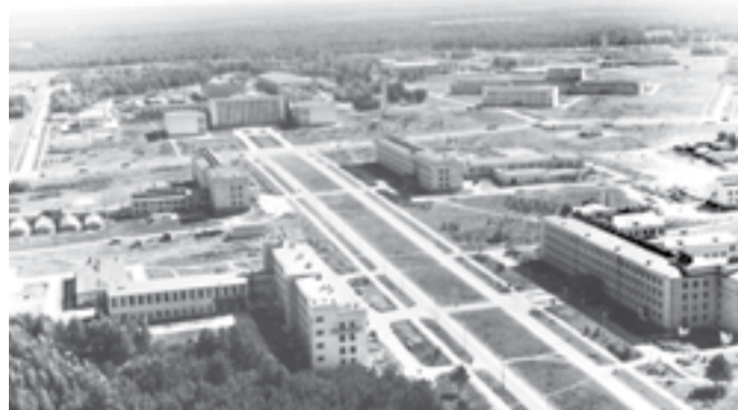
Университетский проспект (ныне проспект Академика Колтыга). Видны Институт ядерной физики (прямо), Институт цитологии и генетики и Институт математики (слева), Институт автоматики и Институт геологии (справа). 1966 г.

Очевидно, что он был одним из «локомотивов» создаваемого района. Тот самый научный центр в Сибири, о котором так много говорили, и проект которого так усиленно продвигали три академика: Михаил Лаврентьев , Сергей Христианович и Сергей Соболев .