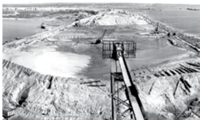
Намыв плотины Новосибирской ГЭС. 1950–1960-е гг.

Новосибирскую ГЭС возводили почти десять лет (если считать от образования специализированного монтажного управления «НовосибирскГЭСстрой» и до сдачи последнего крупного объекта — моста). Кроме того, «НовосибирскГЭСстрой» занимался также и строительством Академгородка. (Правда, в конце августа 1957 года управление не совсем справилось с поставленной задачей. Учтывая, что необходимо было монтировать агрегаты ГЭС, не хватало людей и ресурсов. В связи с этим уполномоченный Оргкомитета СО АН СССР С.Х. Дадаян даже отправил секретарю ЦК КПСС Л.И. Брежнев соответствующую телеграмму, где упирал на срыв решения о создании Сибирского отделения и просил дополнительные рабочие руки.)