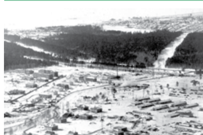
Микрорайон «Щ» в начале строительства. 1961 г.