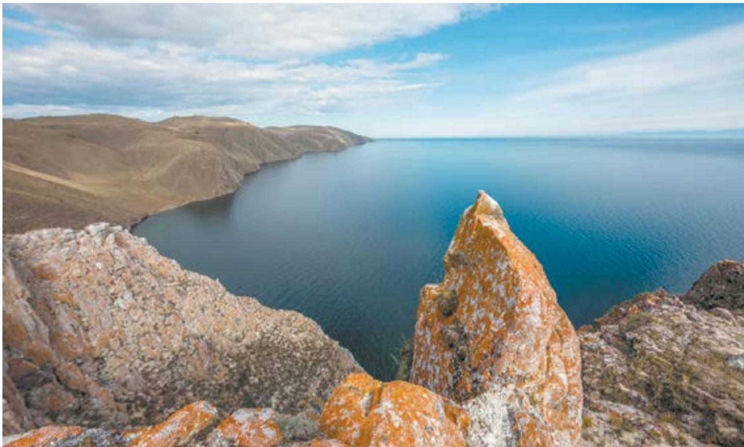
Жемчужина России — Байкал

В настоящее время отходы с Ольхона вывозятся на паромах, источников пресной воды на острове практически нет (ее добывают из нескольких скважин и продают населению). Присутствуют проблемы и с отоплением. На сегодняшний день наиболее дешевый способ обогрева домов там — электричество. Дело в том, что 98 % территории Ольхона — это национальный парк, в котором без разрешения даже грибы собирать нельзя. Получается, единственный приемлемый путь развития для острова — новые энергоэффективные экологические технологии.