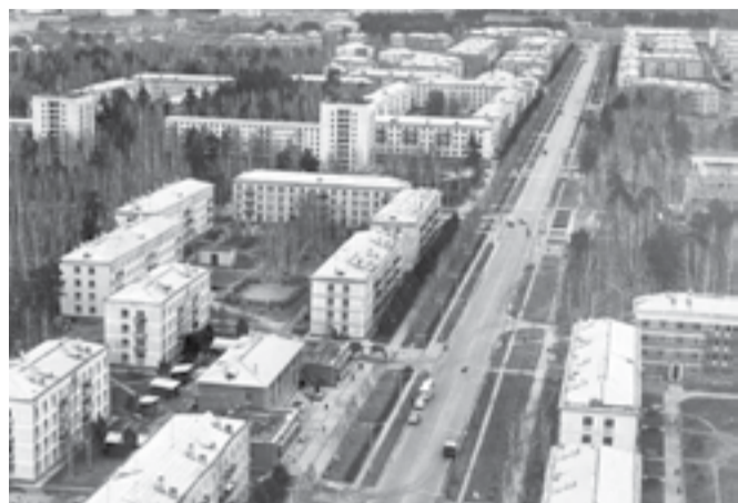
Центральная улица новосибирского Академгородка — Морской проспект. 1970 г.

Советский район Новосибирска начался с двух великих строек: ГЭС и научного центра, которые разворачивались в 1950-е годы. Глобальными проектами руководили из города, что было весьма неудобно. Чтобы оперативно решать возникающие проблемы (развитие инфраструктуры, вопросы строительства, доставка материалов), необходимо было иметь административные структуры, принимающие решения, в одном месте.