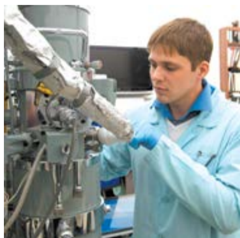
Эксперимент на электронном микроскопе со встроенной сверхвысоковакуумной камерой

Лето – пора экспедиций и полевых работ. Специалисты Томского научного центра СО РАН побывали в нескольких сибирских регионах, чтобы оценить влияние изменений климата на экосистемы, а также изучить состав вод различного происхождения.