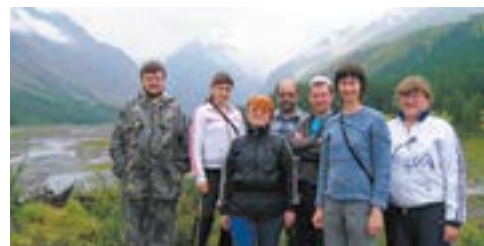
Группа сотрудников лаборатории динамики и устойчивости экосистем ИМКЭС СО РАН на фоне горно-ледникового бассейна Актру