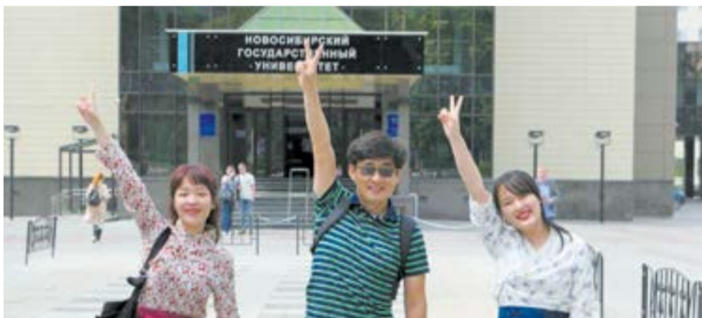
...на фоне Новосибирского государственного университета