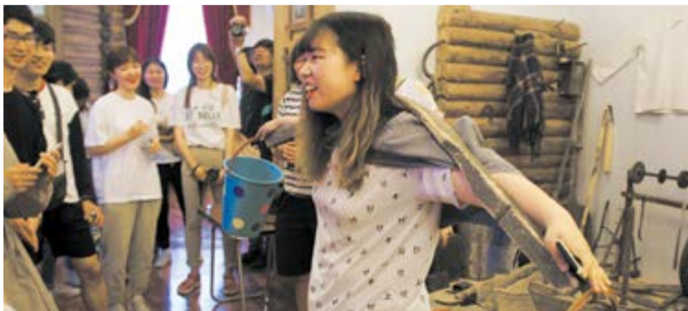
...в Куйбышевском краеведческом музее