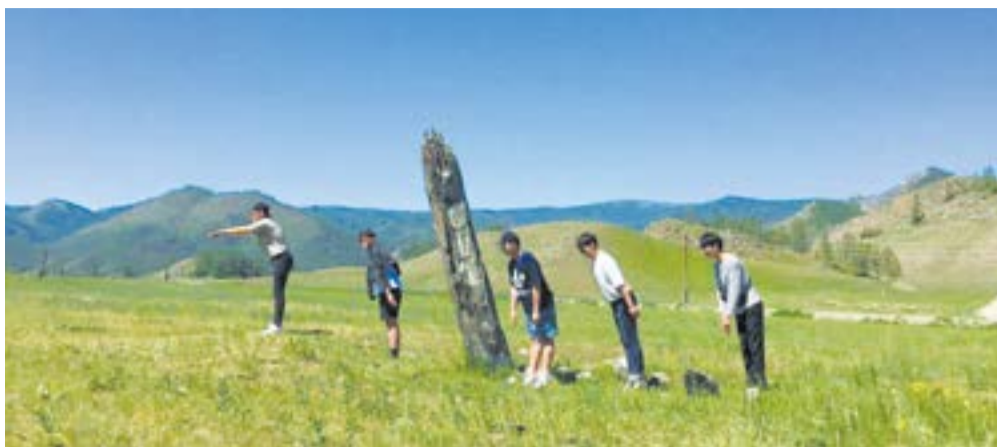
Участники летней школы на урочище Калбак-Таш...

Студенты и профессор корейского университета Кёнхи посетили Новосибирск в рамках Международной археологической полевой школы, организованной Новосибирским государственным университетом совместно с Институтом археологии и этнографии СО РАН. Во время краткосрочной стажировки делегация из Южной Кореи познакомилась с основными достижениями сибирской археологии и посетила наиболее известные памятники.