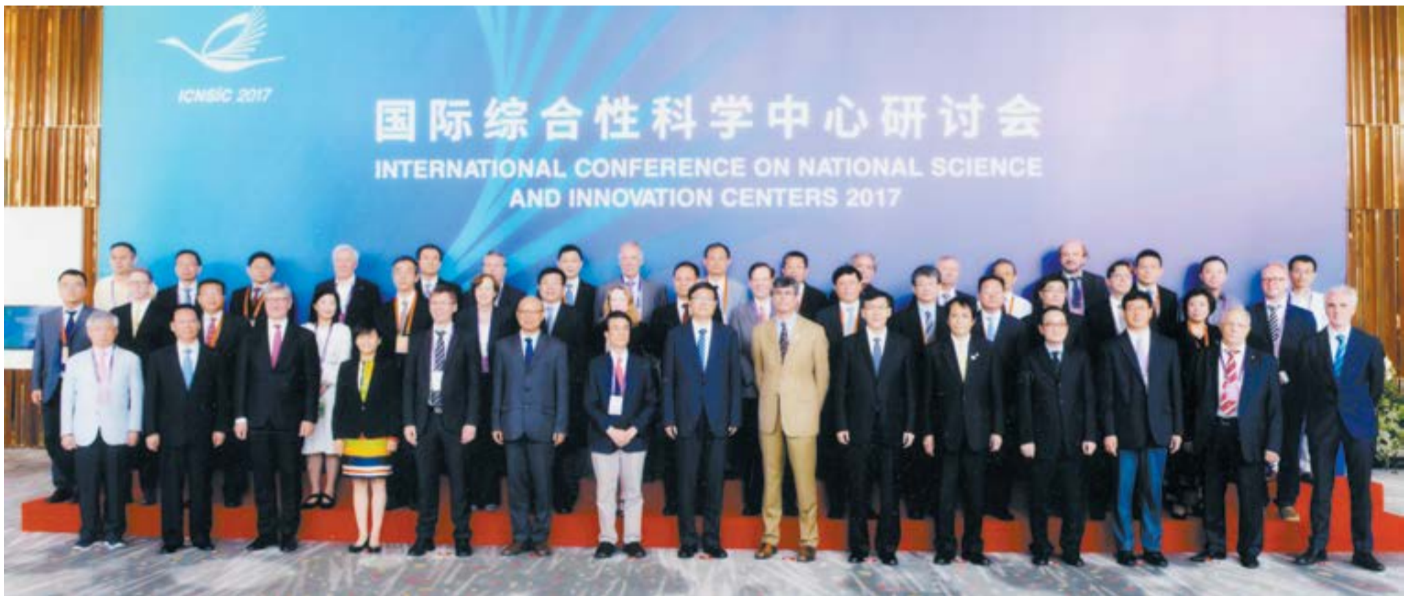
Участники Международной конференции по вопросам организации и деятельности научных и инновационных центров

В июле в пригороде Пекина Хайроу (Huairou) состоялась Международная конференция по вопросам организации и деятельности научных и инновационных центров (International Conference on National Science and Innovation Centers 2017), организованная мэрией Пекина и Академией наук Китая.