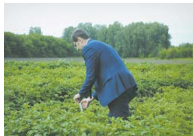
Работа превыше всего!

В каждом мешке находятся клубни, собранные только с одного куста. Представленный кемеровский сорт «кузнечанка» получил высокую оценку от экспертов мероприятия — прежде всего за вкусовые качества. Он выведен специально для Сибири и Дальнего Востока, а еще неприхотлив в уходе.