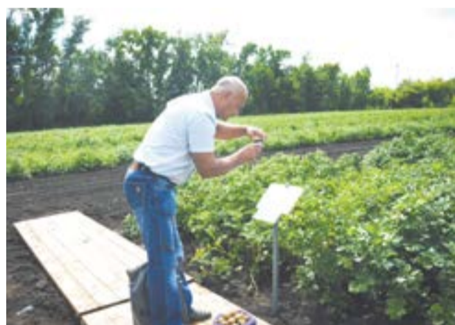
От «А» до «Я»

Еще один выведенный новосибирскими селекционерами сорт «лина» помимо вкусовых качеств и устойчивости к ряду болезней обладает другим преимуществом — высокой крахмалистостью. Также из него получаются хорошие чипсы.