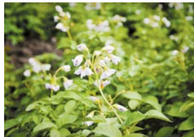
От чего зависит цвет?

Фиолетовый картофель — один из самых экзотических сортов, представленных на Дне поля. Подобные сорта для диетического питания обладают различными оттенками и используются уже давно. Прежде всего носители антоциана (содержащегося в растениях пигментного вещества) являются антиоксидантами, а это большой плюс для здоровья человека: они защищают клетки от различных вредных факторов и способствуют омоложению. Кроме того, фиолетовый картофель очень вкусный и легко выращивается.