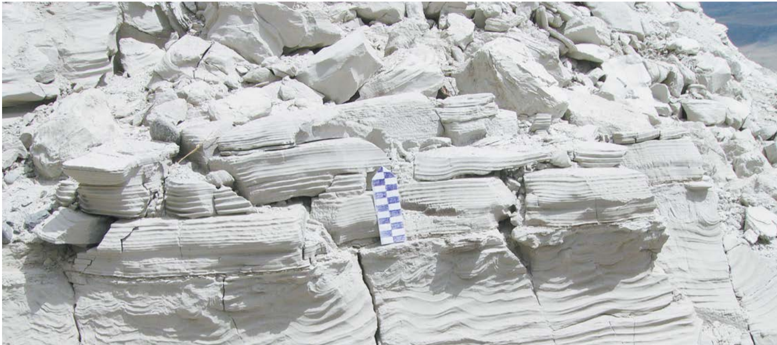
Озерные отложения в разрезе Чаган — наиболее перспективные для дальнейших геохронологических исследований: в отличие от морен их ТЛ даты, полученные в разных лабораториях разными методиками, имели большую сходимость и показали среднеплейстоценовый возраст (260–500 тыс. лет). Этот возраст еще предстоит заверить другими методами датирования

Региональная стратиграфическая схема показывает возрастное соотношение геологических пород в пределах крупного региона с общей геологической историей. Ледниковые и межледниковые отложения Алтая отражены в региональной стратиграфической схеме четвертичных отложений Алтае-Саянской области.