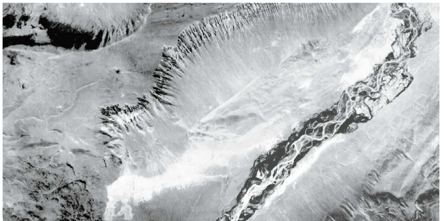
Аэрофотоснимок разреза Чаган, сделанный в 1955 г. Обнажение рыхлах отложений на левом склоне долины реки Чаган составляет 4 км в длину, высота склона от бровки до подножия достигает 270 м

Соб.инф. Фото предоставлены Анной Агатовой